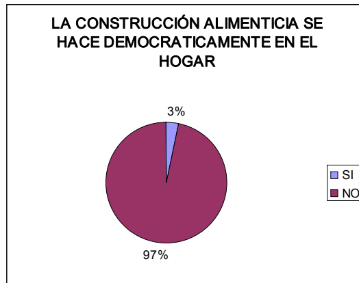
Figura 2. La construcción alimenticia se hace democráticamente en el hogar